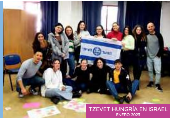
TZEVET HUNGRÍA EN ISRAEL ENERO 2023

Fueron capacitados bajo este marco que fomenta el análisis a través de herramientas educativas.