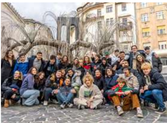
SBM Budapest, Febrero 2023

España, Hungría, Grecia, Bélgica, Portugal y Turquía.