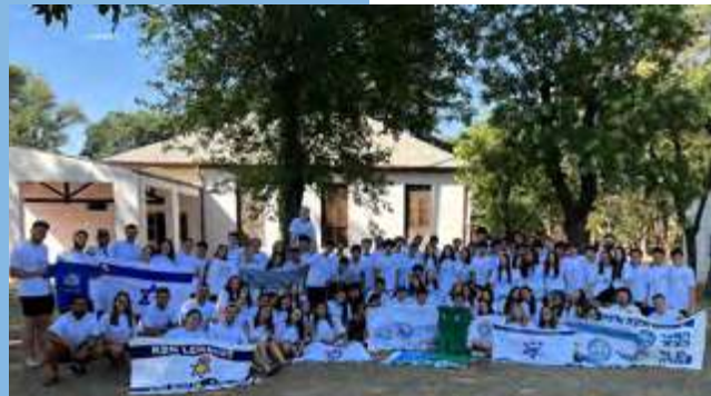
MAJON CONTINENTAL DROMI '69 ENERO 2023

Hanoar Hatzioni, Tzeirei Ami, Centro Juventud Sionista, Israel Hatzeira, Olam Beiajad, Netzah Israel y Dor Jadash.