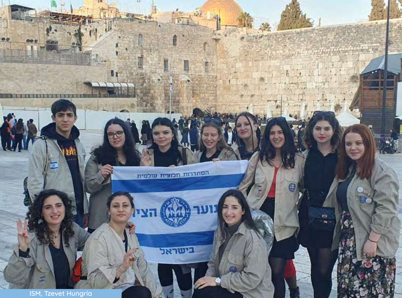
ISM, Tzevet Hungría