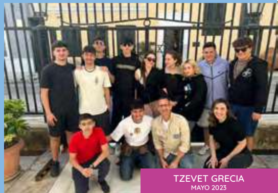
TZEVET GRECIA MAYO 2023